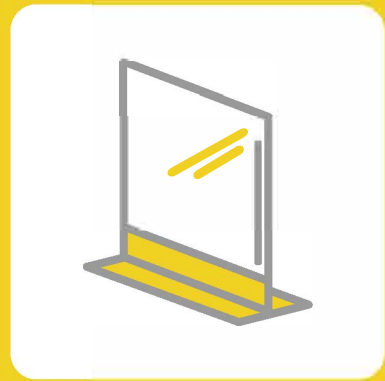
アクリル板の設置